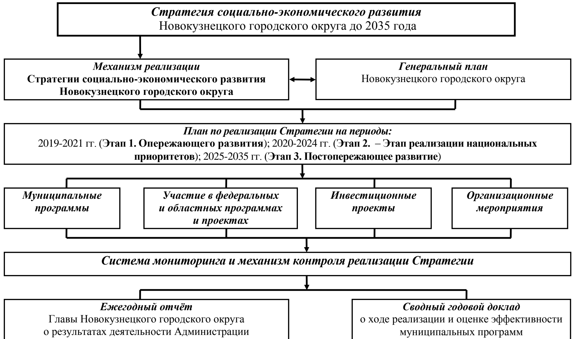
Рисунок 2 – Механизм реализации Стратегии Новокузнецкого городского округа